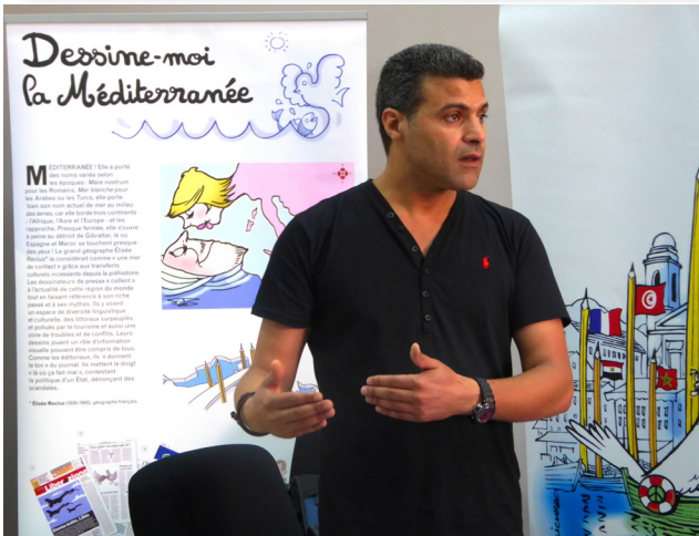
Présentation de « Dessine-moi la Méditerranée » aux organisations de jeunesse marocaines, dans le cadre du programme NET-MED Youth de l'UNESCO.