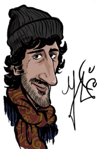
Yas (Maroc -France)