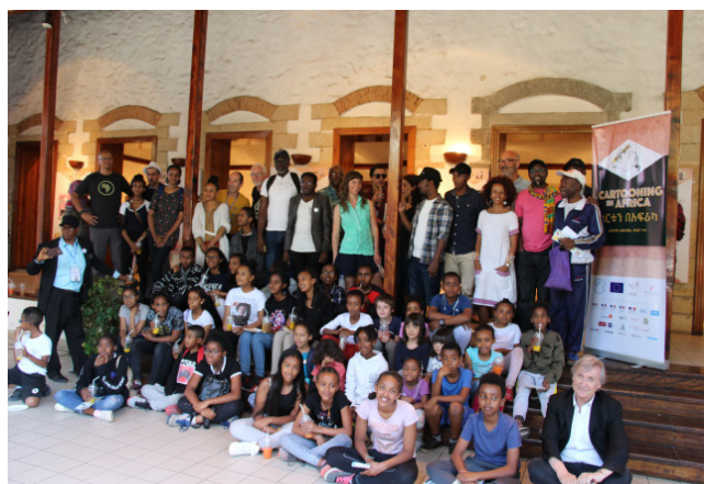
L'atelier pédagogique organisé à l'alliance Ethio-française d'Addis Abeba en partenariat avec Whiz Kids Workshop, mai 2019