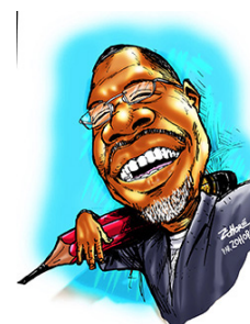
Zohoré (Côte d'Ivoire)