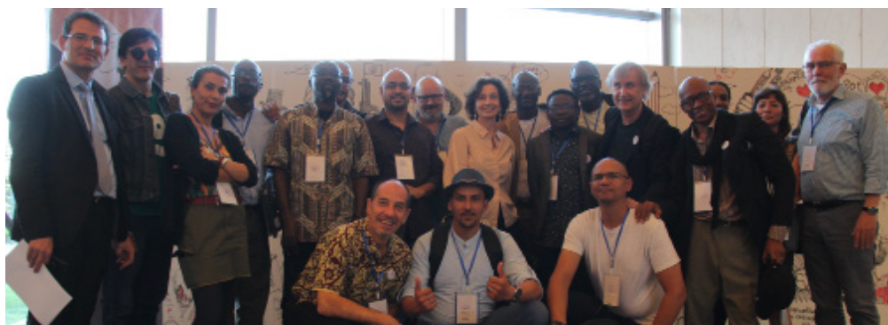
Les dessinateurs de presse devant la fresque collective à l'Union africaine en mai 2019

Édité par les éditions Calmann-Levy, le livre «AFRICA» aborde toutes les questions liées à la liberté de la presse à travers le portrait des 20 dessinateurs et dessinatrices africains réunis en 2019 à Addis Abeba. En librairie.