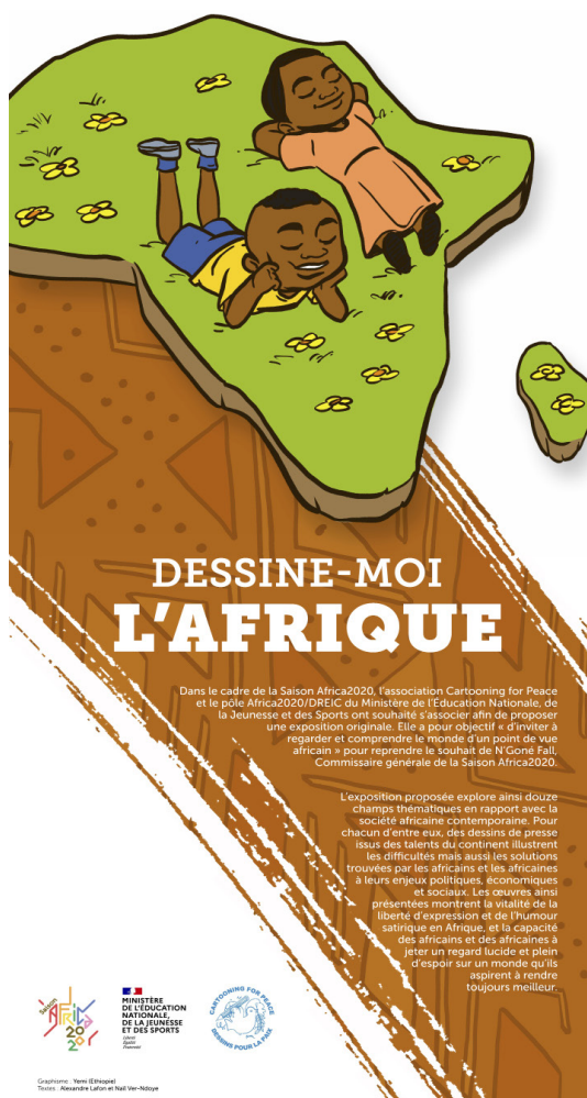
Planche de l'exposition «Dessine-moi l'Afrique»

Pour Africa 2020, 20 ateliers-rencontres (en présentiel ou en numérique) et 1 grande conférence pédagogique en juin, animés par des dessinateurs de presse africains, nourrissent la saison afin de sensibiliser les plus jeunes (dont des collégiens de REP, REP +, bénéficiaires des maisons de la jeunesse) à ces enjeux déterminants et de leur faire découvrir la pluralité et la richesse de ce continent tout en favorisant le développement de l'esprit critique.