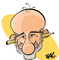
Kak (France), Président