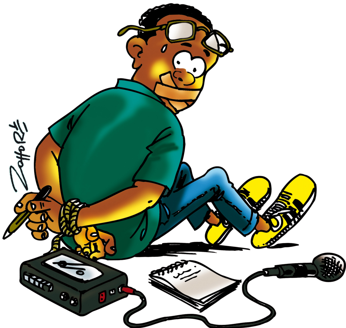
Zohoré (Côte d'Ivoire)

France Média Monde (RFI, France 24, MCD) France Culture Le Monde Afrique