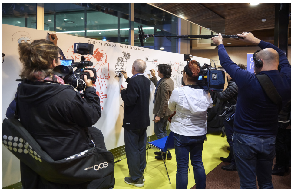
Les dessinateurs en train de réaliser une fresque collective au Forum mondial de la Démocratie au Conseil de l'Europe à Strasbourg, novembre 2019